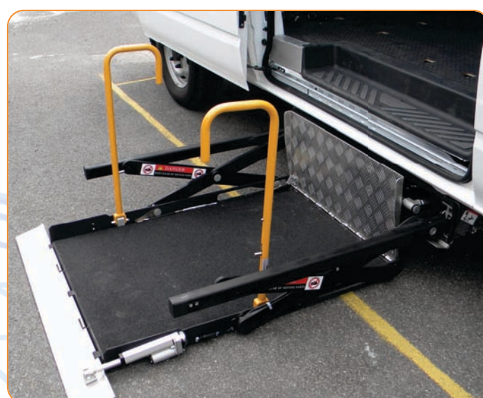
TRAN-US PEDANA TOTALMENTE AUTOMATICA TRAN-US Plataforma completamente automática