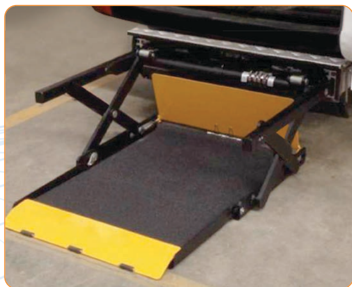
TRAN-UF PEDANA SEMI AUTOMATICA TRAN-UF Plataforma semiautomática

Dentro de la gama existen modelos semiautomáticos TRAN-UF o totalmente automáticos TRAN-US. Los elevadores vienen suministrados con tele-comando de gestión y están dotados de sistema de emergencia y bloqueo manual.